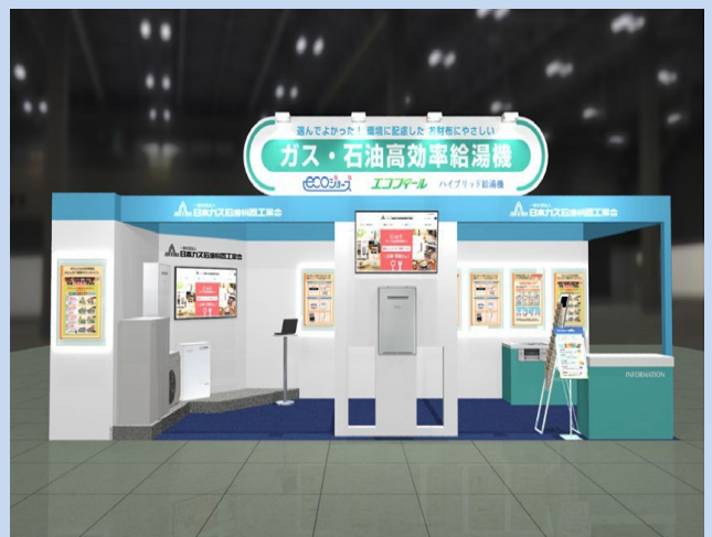
工業会ブースイメージ (東5ホール 5-031)